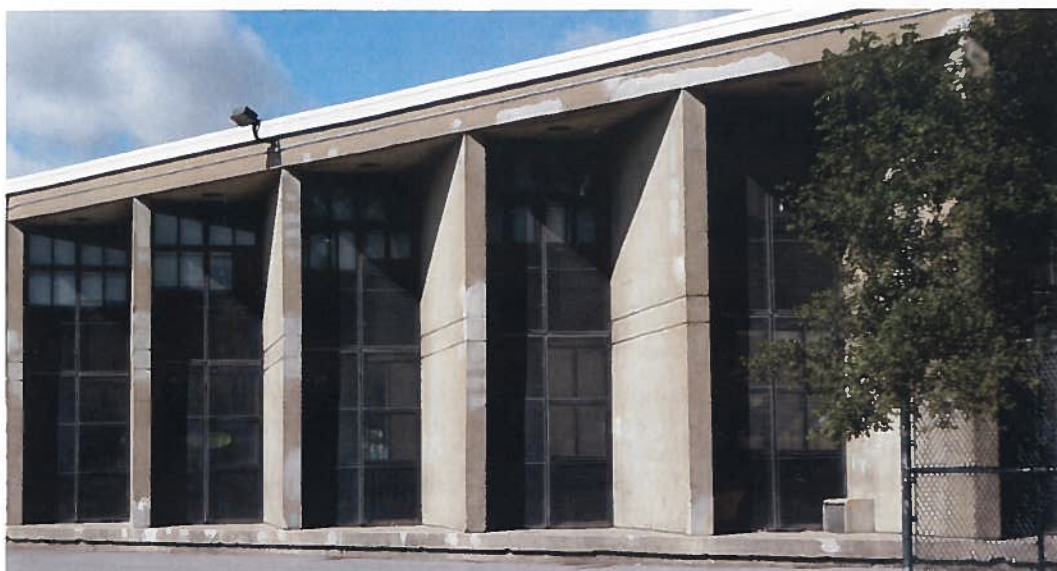
Fig. 1. Redents d'une des façades latérales.