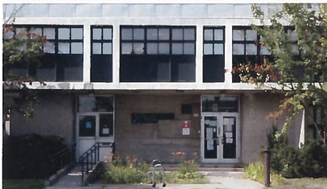
Fig. 3. Façade principale, avenue Christophe-Colomb. L'œuvre d'art se trouve entre les deux portes.